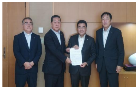
鈴木市長へ予算要望書を提出