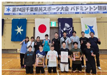
←千葉県民スポーツ大会参加 野田市男女アベック優勝