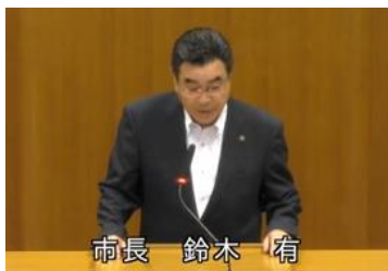
市長 鈴木 有

市民ニーズが多様化している中、その市民ニーズに応えられるよう、重要施策や部局横断的な施策に対応するため、市長直轄の市政推進室を設置したが、十分に機能していない。その要因として業務範囲が広くすべての重要施策に関わらずに調整が限定的になってしまっていると考え。今後も重要施策を