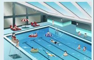
室内プールイメージ

昭和 55 年に開場して以来 42 年が経過しており、大規模に改修するには多額の経費が掛かる。また、利用期間が夏季の 2 カ月程度であり、費用対効果の観点からも再開は非常に困難である。しかしながら、市民のプールに対する要望は多いことから、新たに 1 年を通して利用できる室内温水プールを整備する。将来的には学校の水泳授業の受け入れも視野に様々な整備手法の検討も含め調査業務を委託する。