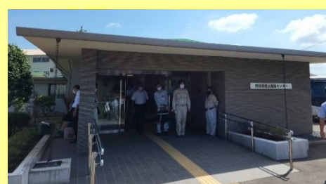
老人福祉センター