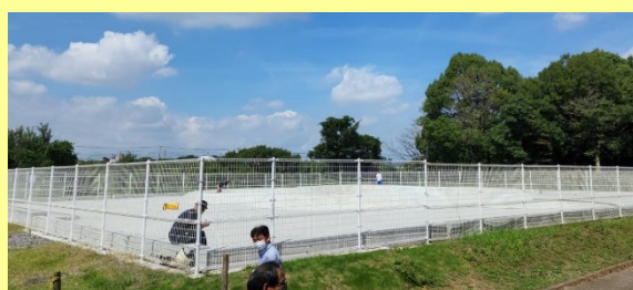
総合公園スケートボードパーク